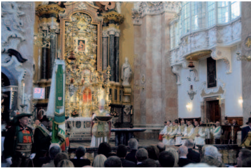
Im Dom zu St. Jakob wurde vor Beginn des Landesfestumzuges ein Pontifikalamt mit Bischof Manfred Scheuer gefeiert.