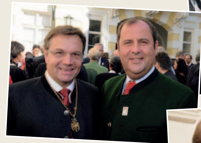
LH Günther Platter und Vizekanzler Josef Pröll sowie LHStv Hannes Gschwentner und Bundeskanzler Werner Faymann im Innenhof der Hofburg.