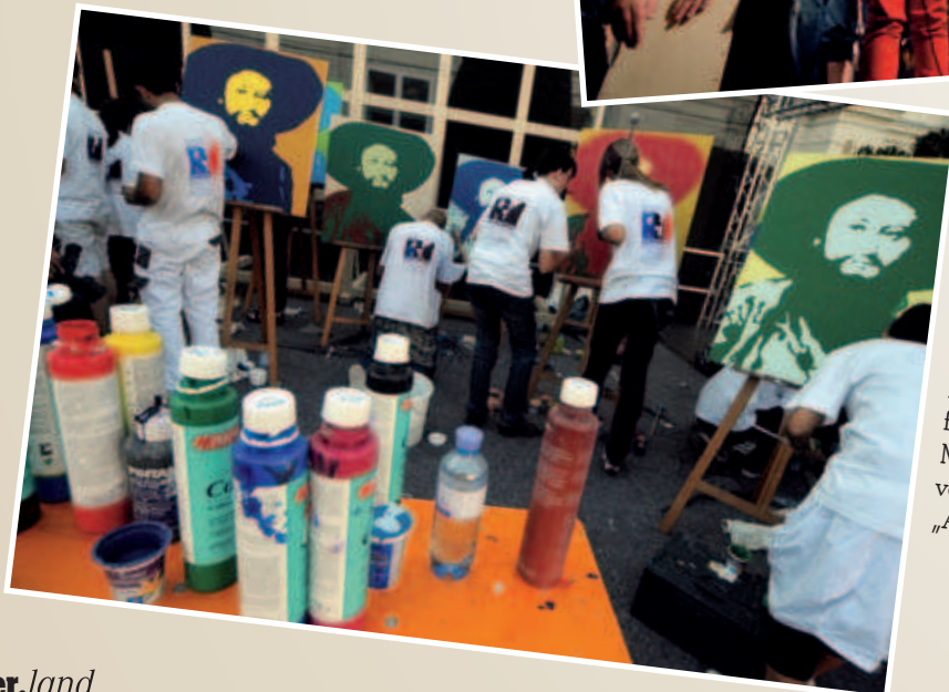
15 SchülerInnen der Tiroler Fachberufsschule für Bautechnik und Malerei, Absam, und der HTL Malerei, Innsbruck, erstellten Samstagnachmittag vor der Hofburg in Innsbruck gemeinsam ein „Andreas-Hofer-Porträt“.