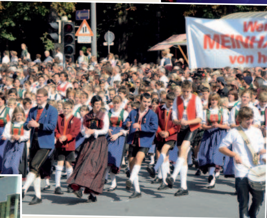
70.000 ZuschauerInnen verfolgten den knapp fünfstündigen Landesfestumzug.