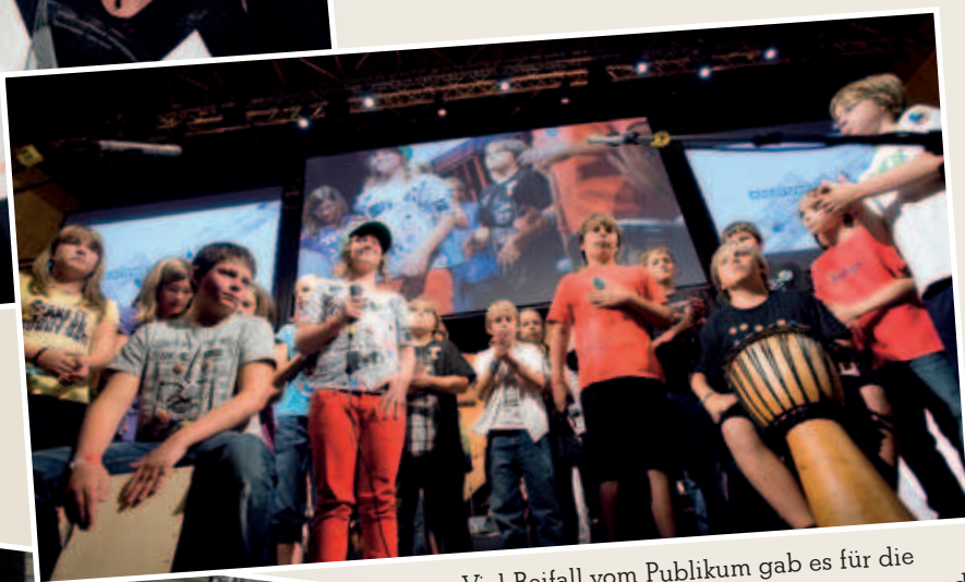
Viel Beifall vom Publikum gab es für die Showeinlagen der jungen Musikerinnen und Musiker.