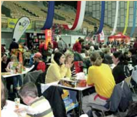
Trotz Spielanleitung Endstation? Die Spielefeuerwehr in ihren gelben T-Shirts weiß immer Rat.

Um sich die Spiele zum Test vor Ort ausleihen zu können, brauchen Sie zunächst einen Spielepass. Er dient als Einsatz (siehe Kasten rechts). Das ideale Familienspiel ist schnell erklärt, hat einfache Regeln und dauert auch nicht zu lange. Von dieser Sorte gibt es auf der Spielmesse eine ganze Menge zum gemeinsamen spielerischen Erproben. Wer trotzdem einmal nicht mehr weiterweiß oder sich für ein schwierigeres Spiel entschieden hat, der kann sich an eine(n) der SpieleexpertInnen wenden, die sich im Vorfeld der Messe mit dem Spieleangebot speziell auseinandergesetzt haben und als „Spielefeuerwehr“ bereitstehen.