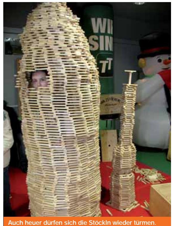
Auch heuer dürfen sich die Stöckln wieder türmen.