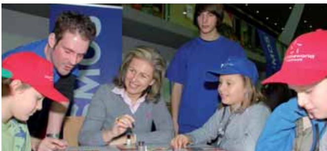
Die spielaktiv soll ein Fixpunkt im Veranstaltungskalender des Landes Tirol bleiben und damit auch ein besonders angenehmer Pflichttermin im Kalender von Familienlandsrätin Patrizia Zoller-Frischauf.

Die Familienfreizeit- und Spielmesse des Landes Tirol hat sich in den 16 Jahren ihres Bestehens zum Fixpunkt im Familienkalender entwickelt. Die einen kommen, um sich über die neuesten Spiele zu informieren und Anregungen für ein nettes, sinnvolles Weihnachtsgeschenk zu entdecken, die anderen schätzen das reichhaltige Rahmenprogramm und die Freizeittipps der Familienpass-Partnerunternehmen des Landes Tirol. So wird diese Veranstaltung, die jedes Jahr rund 20.000 Besucher anlockt, immer wieder für alle zu einem ereignisreichen Familientag und wird daher auch weiterhin ein Schwerpunkt im Rahmen der Familienangebote des Landes Tirol bleiben. Auf den nächsten Seiten geben wir Ihnen einen kleinen Überblick über das Programm der spielaktiv 2010.