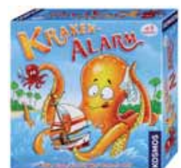
Tierische Action bietet heuer der Stand des KOSMOS-Spielverlages.

Ein weiteres Highlight stellt Ken Folletts „Die Tore der Welt“ dar. Das Brettspiel zum gleichnamigen Roman schickt die Mitspieler ins England des 14. Jahrhunderts, wo sie sich als Bürger von Kingsbridge mit zahlreichen Herausforderungen des mittelalterlichen Lebens konfrontiert sehen. Übrigens: Das Brettspiel wurde 2010 mit dem Preis „Spiel des Jahres plus“ für anspruchsvolle Spiele ausgezeichnet.