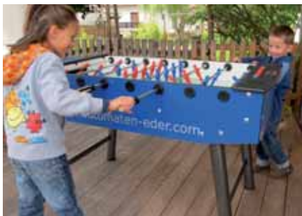
Kindersicheres Spielen – Spielmessebeispiel: Tischfußball mit Teleskopstangen.

Seit Einführung der Spielmesse des Landes Tirol im Jahr 1995 präsentiert die veranstaltende Abteilung JUFF (Jugend/Familie/Frauen/Senioren/Integration) auf ihrem Stand Spezialthemen oder Spezialprodukte zum Thema „gemeinsame Aktivitäten“. Heuer zeigen wir kindersichere Tischfußballtische. Zudem wird es am JUFF-Stand Materialien zum Thema Kindersicherheit in verschiedensten Bereichen geben. Die Fußballtische werden von der Fa. Automaten Eder zur Verfügung gestellt. Das Infomaterial zum Thema Kindersicherheit kommt vom Verein Sicheres Tirol.