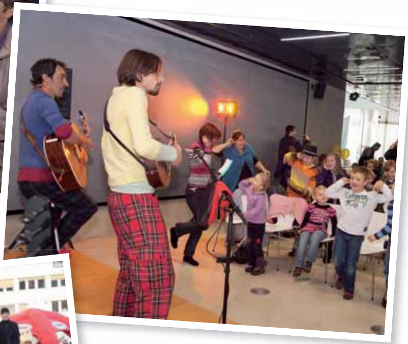
Ratz-Fatz unterhielt mit einer gelungenen Theatervorführung und animierte die Kinder zum Mitmachen.