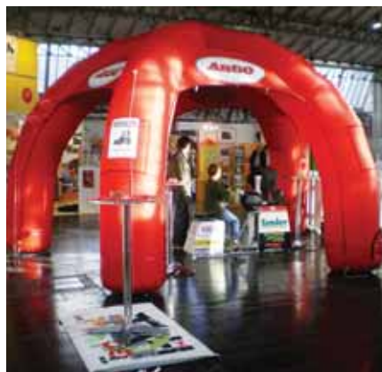
Verkehrserziehung auf spielerische Art präsentiert der ARBÖ.

Eine willkommene Abwechslung mit viel Action und Spaß für spielaktiv -Besucher boten im Vorjahr die erstmals präsentierten Mopedsimulatoren des ARBÖ. Deshalb sind sie auch heuer wieder mit dabei. Eltern erhalten bei dieser Gelegenheit auch gute Tipps rund um das Thema „Unterwegs auf zwei Rädern“.