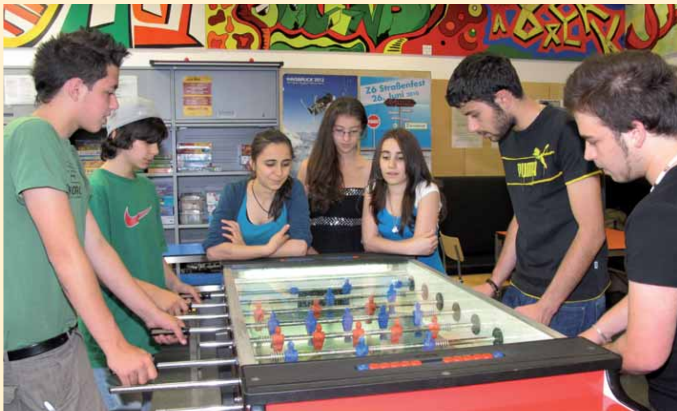
Ein gut abgestimmtes Freizeitangebot mit einem lebendigen Vereinswesen, ausreichend sportlichen Angeboten und gut angenommenen Treffpunkt-Möglichkeiten verbindet die Jugendlichen mit ihrem Ort.