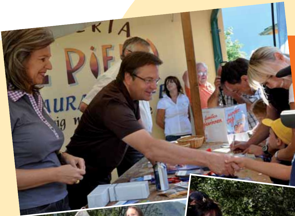
Foto links: LH Günther Platter und Familienlandesrätin Patrizia Zoller-Frischauf begrüßten die Familien beim Infostand. Foto unten: Tolle Kreationen entstanden beim Filzen.