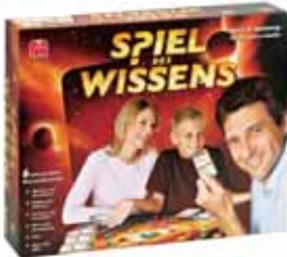
Das Spiel des Wissens von JUMBO bietet Spaß und Spannung für die ganze Familie.

JUMBO präsentiert sich auch heuer wieder mit einem eigenen Stand mit Spielen für die ganze Familie. Für die kleinen Besucher ab 3+ ist mit dem Spiel „Schloss Logikus“ aus der Smart Games Reihe für