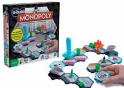
Monopoly von HASBRO: Der Renner dieser Spielesaison – das berühmte Spiel in neuer Form.

stellungsstand in der Olympiahalle. Das bekannte Spiel „Monopoly“ kann hier in der neuen, von der aktuellen Fernsehwerbung bereits gezeigten Fassung als Baukastensystem ausprobiert werden. Daneben gibt es eine Reihe anderer toller Neuheiten, die Spaß für die ganze Familie garantieren.