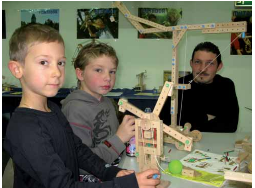
MATADOR – ein österreichischer Hit für Kinder seit Generationen.

Auch heuer haben Kinder wieder die Möglichkeit, am MATADOR-Stand tolle Werke zu konstruieren. Neben den Spielmöglichkeiten können die Kinder bewegliche Modelle bestaunen. Für Eltern gibt es ausreichende Informationen für eine altersgerechte Produktauswahl.