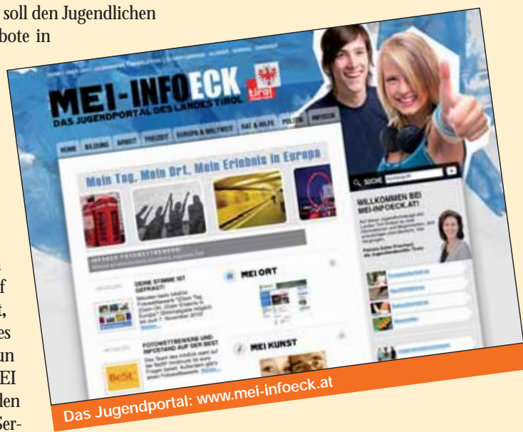
Das Jugendportal: www.mei-infoeck.at

vice für die Jugend bereitgestellt haben. Reinschauen lohnt sich!