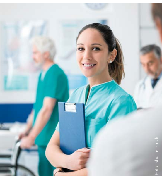
Die Pflege ist der Kern der Daseinsvorsorge.