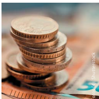
Förderungen: jetzt abholen! — SEITE 30