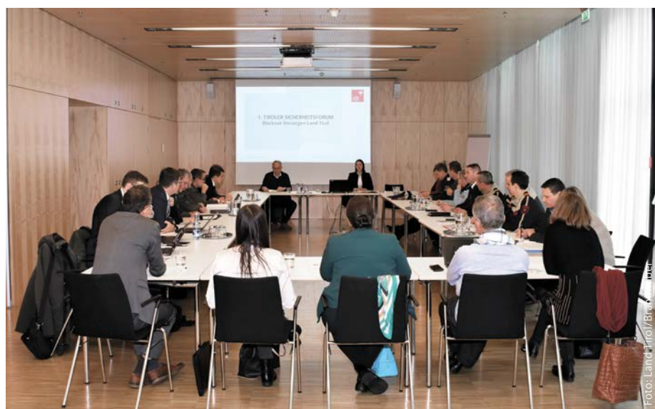
Sicherheitslandesrätin Astrid Mair berief kürzlich das „1. Tiroler Sicherheitsforum“ ein, um mit Einsatzorganisationen und Behörden aktuelle Sicherheitsthemen zu besprechen und die Vernetzung weiter zu fördern.