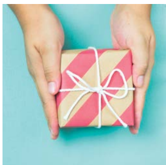
Lebensmittel und Geschenke: aus der Region, für die Region — SEITE 12