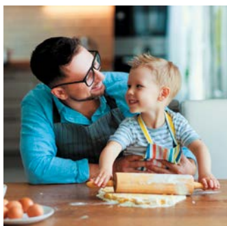
Kulinartipp: Traditionelles aus der Euregio — SEITE 26