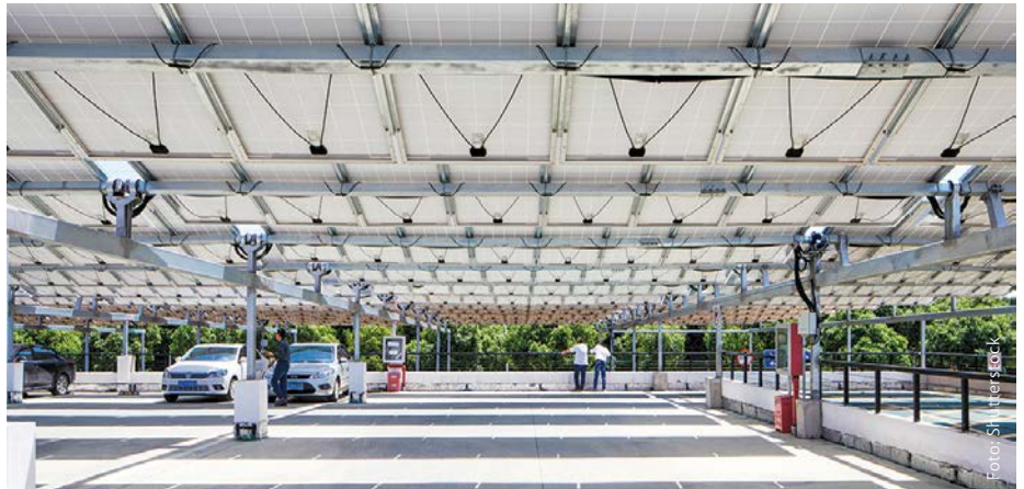
Fünf Millionen Quadratmeter PV sollen in Tirol in den nächsten Jahren auf Großparkplätzen, bereits versiegelten Flächen und zur Stromproduktion geeigneten Dächern installiert werden.

„Es ist eine große Herausforderung, eine fossilsfreie und gleichzeitig krisensichere Energieversorgung aus heimischen Quellen zu erreichen. Nur durch einen massiven Ausbau aller in Tirol verfügbaren und nachhaltig nutzbaren erneuerbaren Energieträger können wir uns aus der Abhängigkeit von Öl und Gas befreien und energieautonom werden. In den kommenden fünf Jahren wollen wir in Tirol alleine fünf Millionen Quadratmeter PV installieren“, erklärt Energielandesrat LHStv Josef Geisler. Nicht nur jedes geeignete Hausdach muss zur Sonnenstrom-