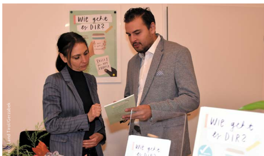
Es gibt unbürokratische, qualifizierte und umfassende Hilfe, speziell auch für Jugendliche, mit persönlicher Beratung und Broschüren beispielsweise wie hier im Bild im InfoEck.