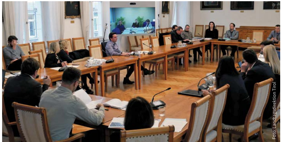
Der „Beteiligungs-Unterausschuss“ ist dem Finanzkontrollausschuss (im Bild) zugeordnet.

beantragt, beleuchtete ein Untersuchungsausschuss rund eineinhalb Jahre lang die Agenden der Tiroler Soziale Dienste GmbH (TSD). Das dazugehörige Gesetz, das die Rahmenbedingungen und Abläufe dieses besonderen Mittels der parlamentarischen Kontrolle bestimmt, stammte jedoch bereits aus dem Jahr 1998 und erwies sich in einigen Punkten als reformbedürftig. Die Parteien einigten sich deshalb bereits in der vergangenen Legislaturperiode darauf, dieses Regelwerk gemeinsam zu überarbeiten. Da ein Untersuchungsausschuss ein besonders starkes „Kontrollwerkzeug“ der Abgeordneten ist, bedarf die Novellierung einiges an Abstimmungsarbeit unter den Landtagsfraktionen, die dafür ihre Abgeordneten in diesen Unterausschuss des Fachausschusses für Wohnen, Raumordnung, Rechts- und Gemein-